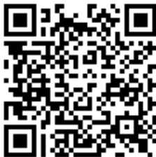
Código QR para validación en sede

Regulación CSV: Decreto 3628/2017 de 20-12-2017